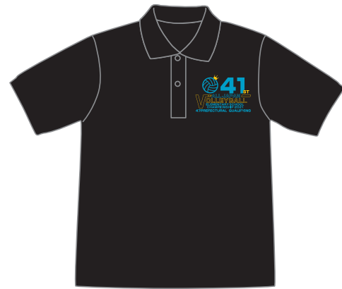
A フロントデザインのみ